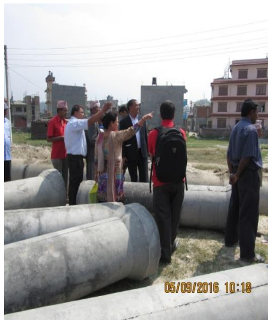
आयोजना निर्माण चरणको अवस्था