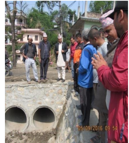
आयोजना सम्पन्न भएपश्चात् को अवस्था