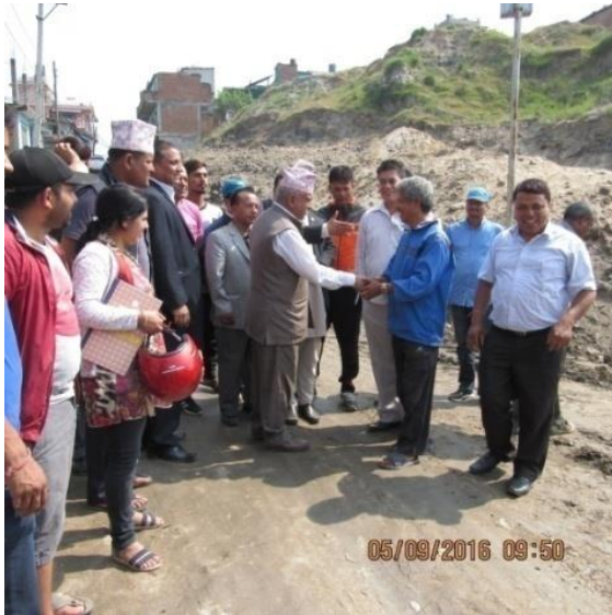
आयोजना शुरुहुनुभन्दा पूर्वको अवस्था